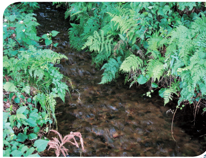
六軒 湧水さかさ水

枝払い、間伐、環境整備、例大祭、花見、説明版の作成 鬼柳町南側の東端に位置し、そこからは鬼柳地区はもとより市街を一望できる。また、釣垂れの岩や亀岩など奇岩や銘木が多数存在する。 ■ 下鬼柳7地割171番地【鬼柳町一区会】