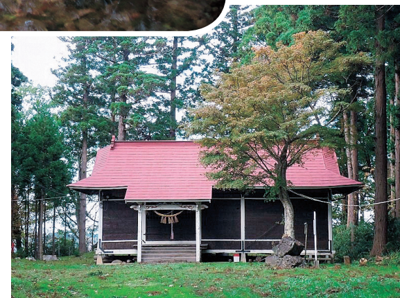
やすらぎの広場 鬼柳白髭神社